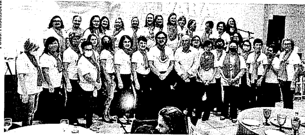
Voluntárias da Ong Mão Amiga foram homenageadas durante o evento.